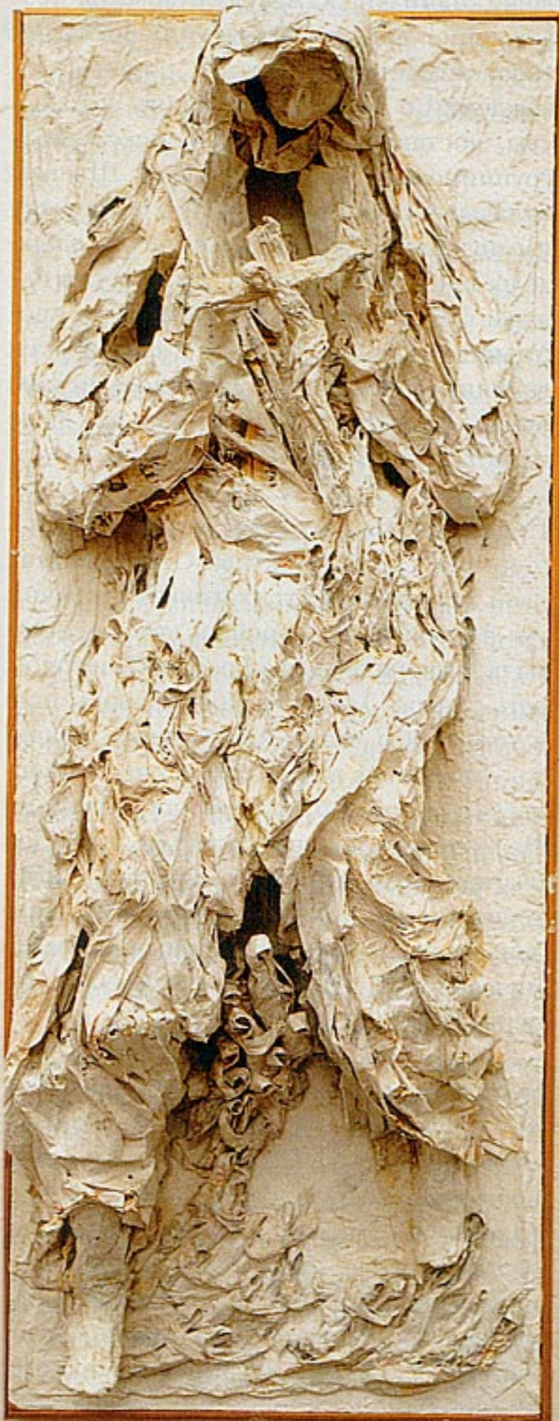
Л. Шульгина «Богоматерь» газета, бумага, 1985